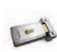
PLA11 Serrure électrique 12 V horizontale (obligatoire pour battant supérieurs à 3 m). P.ces/emb. 1