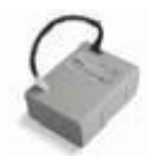
PS124 Batterie 24 V avec chargeur de batterie intégré. P.ces/emb. 1